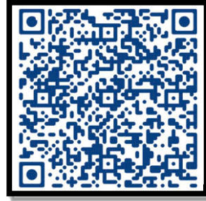
Nhu cầu người tìm việc