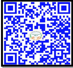
Nhu cầu nhà tuyển dụng